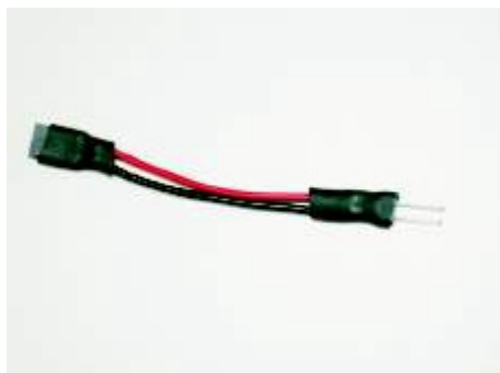
Art.-Nr. 700-023 = Verbindungskabel für Leiterplatten