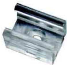
Art.-Nr. 700-013 = Befestigungsclip