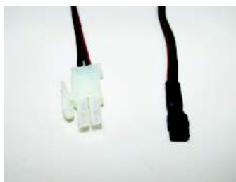
Art.-Nr. 700-022 = Einspeisungskabel